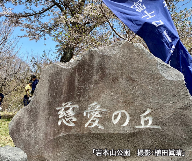
「岩本山公園」