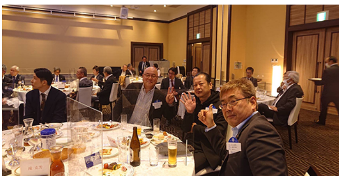
訪問して下さった駿河ロータリークラブの3名