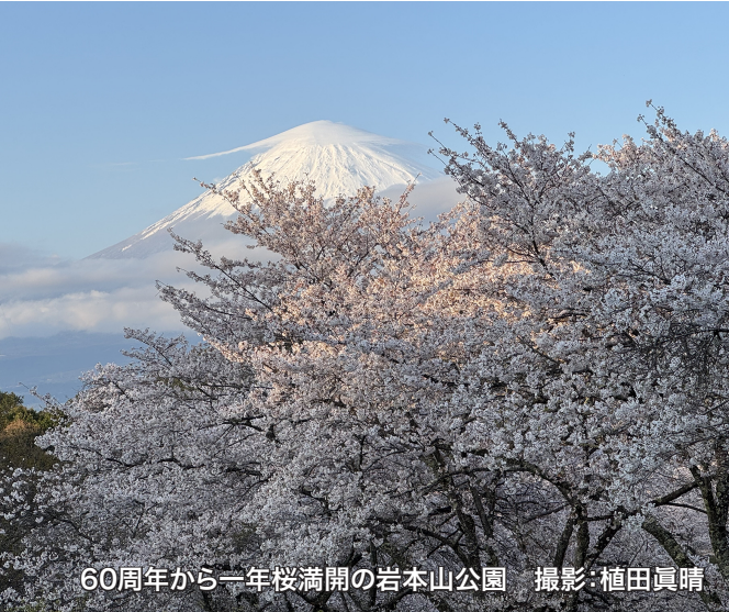
60周年から一年桜満開の岩本山公園